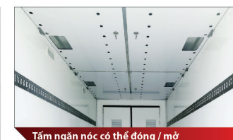
Tấm ngăn nóc có thể đóng / mở