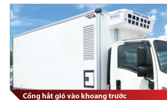
Cổng hút gió vào khoang trước