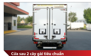
Cửa sau 2 cây gài tiêu chuẩn