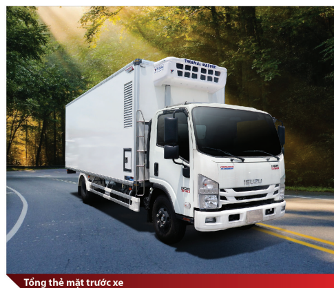
Tổng thể mặt trước xe