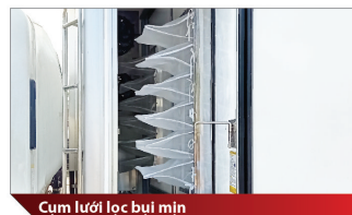
Cụm lưới lọc bụi mịn