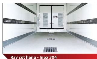
Ray cột hàng - Inox 304