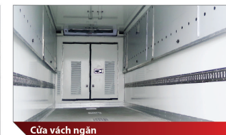
Cửa vách ngăn