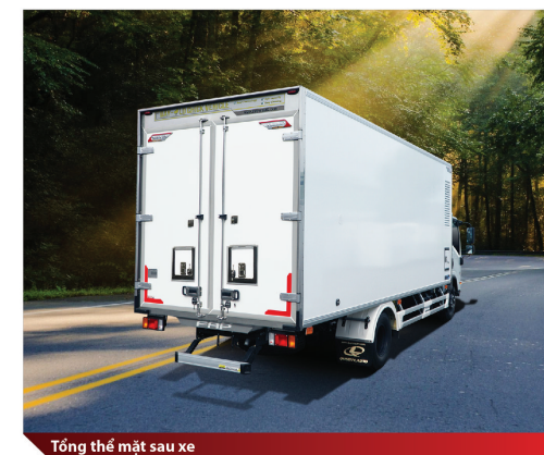
Tổng thể mặt sau xe