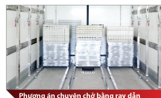
Phương án chuyên chở bằng ray dẫn