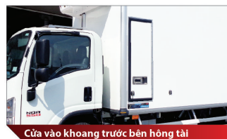
Cửa vào khoang trước bên hông tải