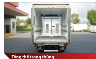
Tổng thể trong thùng