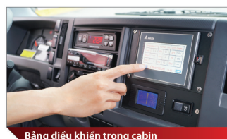
Bảng điều khiển trong cabin