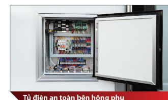
Tủ điện an toàn bên hông phụ