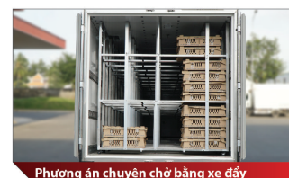
Phương án chuyên chở bằng xe đẩy