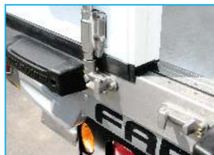
Bộ chốt móc khoá cửa sau inox 304 (Phía dưới)