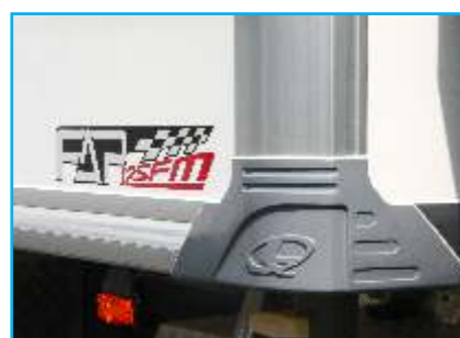
Chụp bo ốp nối góc phía dưới (Composite)