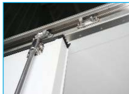
Bộ chốt móc khoá cửa sau inox 304 (Phía trên)