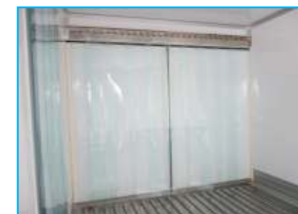
Màng nhựa PE (Ngăn giữ hơi lạnh khi mở cửa)