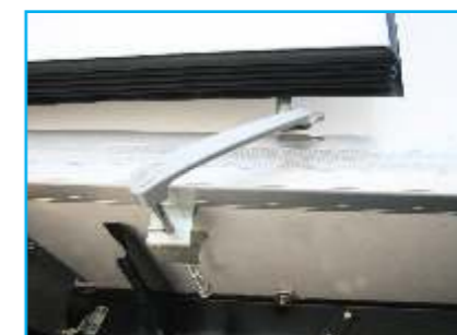
Tay nắm giữ cánh cửa phía sau khi mở ra