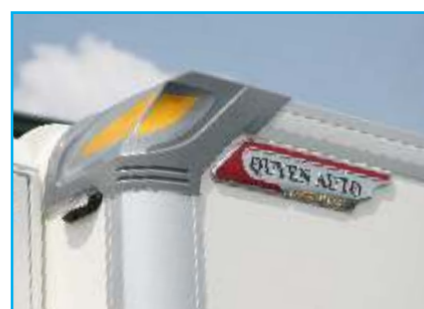
Chụp bo ốp nối góc phía trên (Composite)