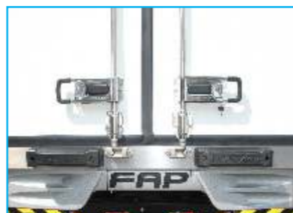
Bộ tay khoá cửa sau Inox 304