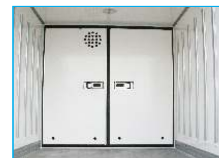
Vách ngăn cố định 2 cửa mở