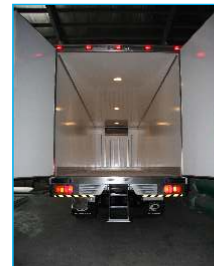
Đèn thấp sáng bên trong thùng