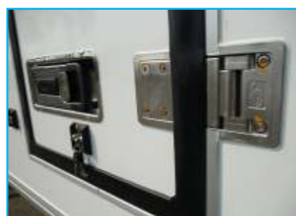
Bộ tay khoá + Bản lề cửa hông Inox 304