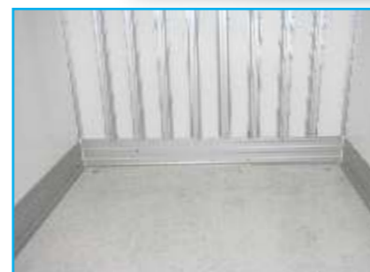
Sàn bằng có phủ lớp Composite chống trượt