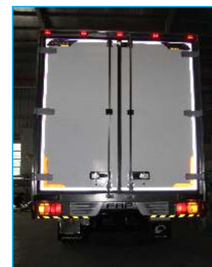
Đèn báo cao sau thùng (Led)