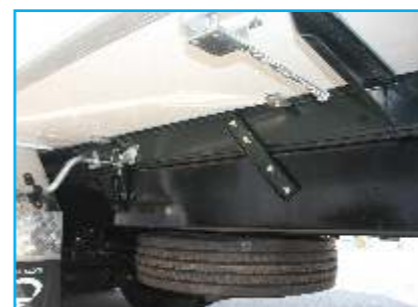
Các bát liên kết giữ thùng vào khung xe