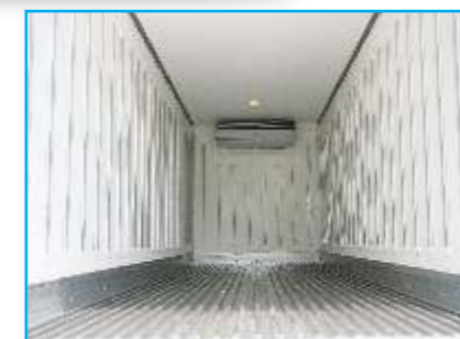
Sàn inox dập sóng gân