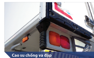
Cao su chống va đập