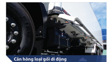
Cản hông loại gối di động