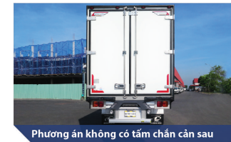
Phương án không có tấm chắn cản sau