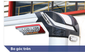
Bô góc trên