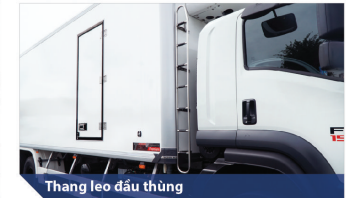
Thang leo đầu thùng