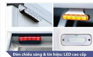
Đèn chiếu sáng & tín hiệu: LED cao cấp