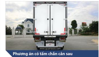
Phương án có tấm chắn cản sau