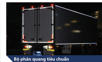
Bộ phận quang tiêu chuẩn