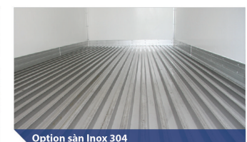
Option sàn Inox 304