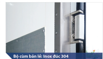
Bộ cùm bản lề: Inox đức 304