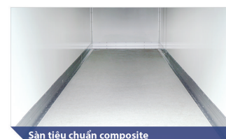
Sàn tiêu chuẩn composite