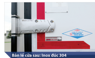
Bản lề cửa sau: Inox đức 304