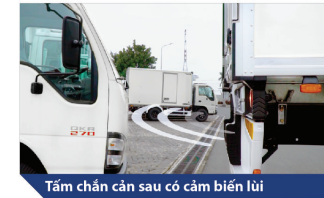
Tấm chắn cản sau có cảm biến lùi