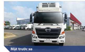
Mặt trước xe