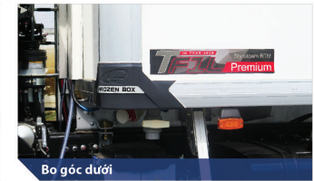
Bô góc dưới