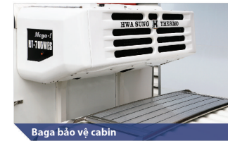
Baga bảo vệ cabin